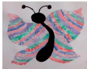
Kateřina Šemberová, 13 let, ZUŠ Blatná